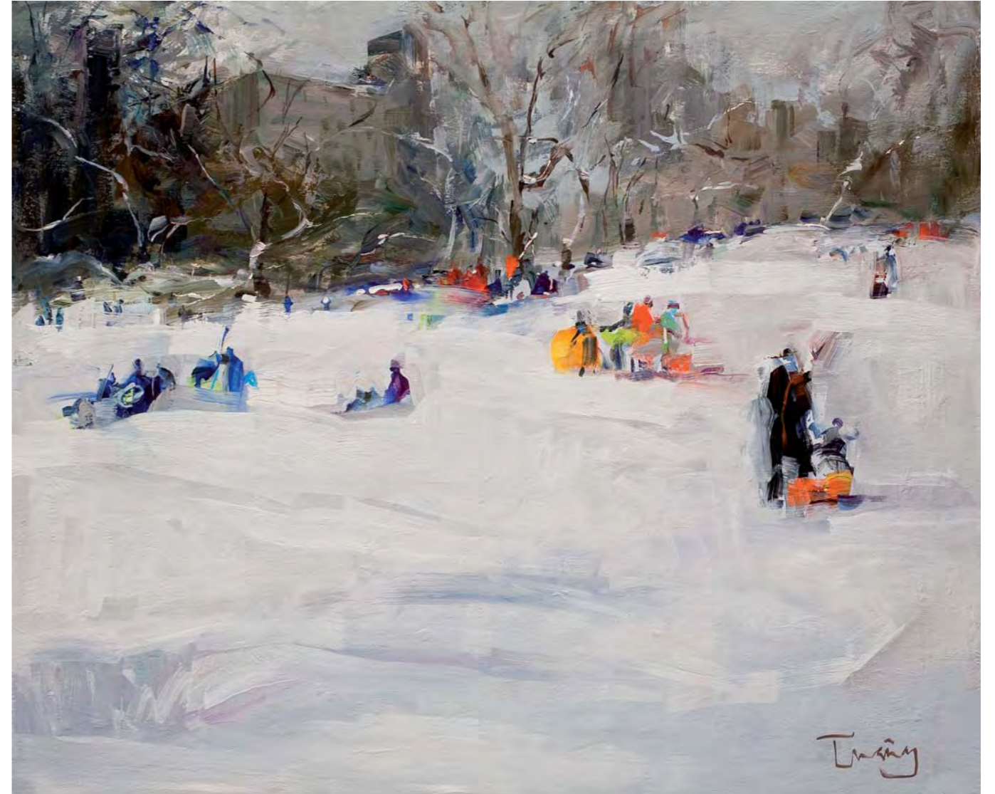
Neu al Central Park. NEW YORK - 60 x 73 cm. oli/tela