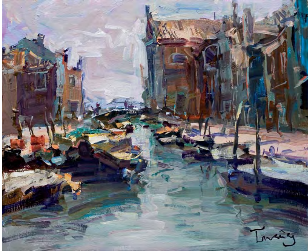
BURANO - 38 x 46 cm. oli/tela