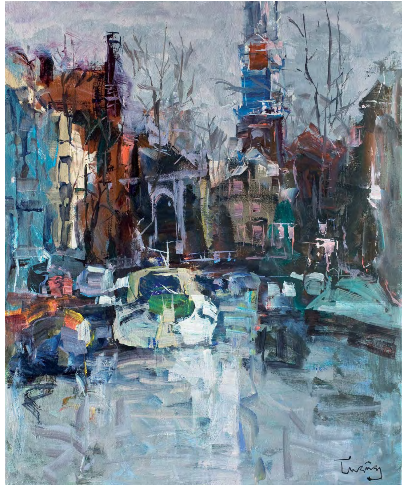
Llums i colors. AMSTERDAM - 73 x 60 cm. oli/tela