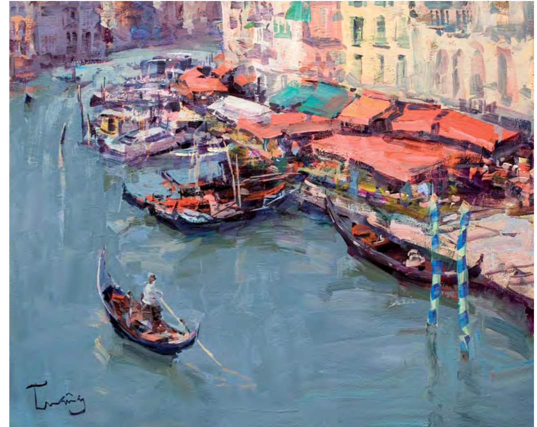
Gran Canal. VENÈCIA - 50 x 61 cm. oli/tela