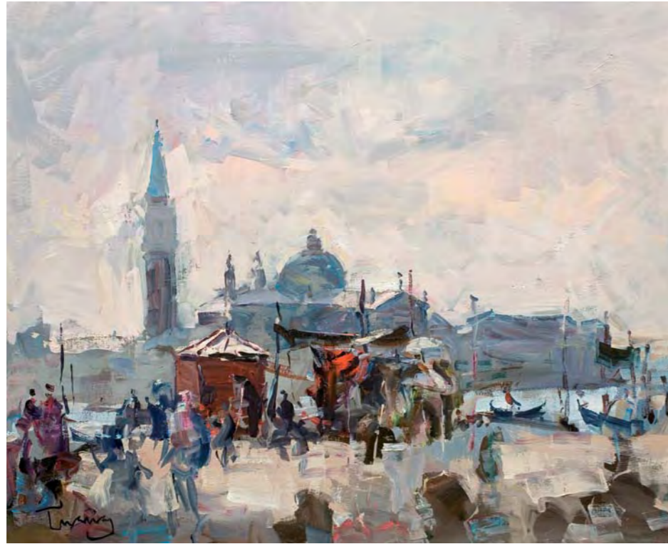
VENÈCIA - 50 x 61 cm. oli/tela