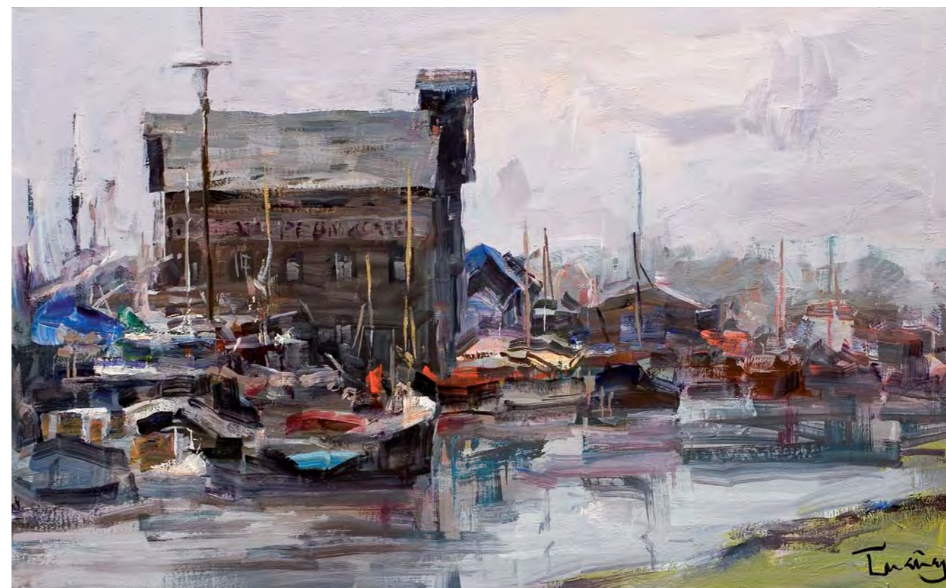
Faversham Creek. LONDRES - 41 x 65 cm. oli/tela