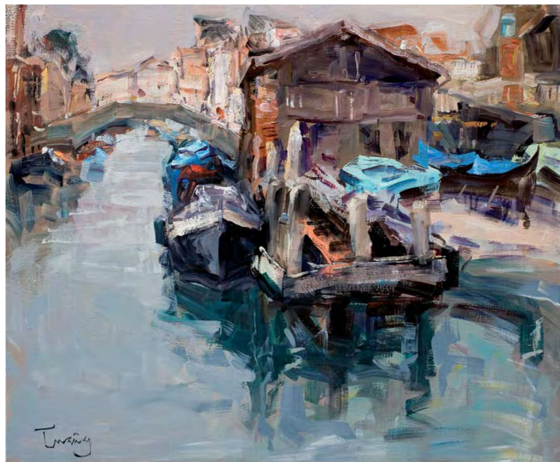
Campo de San Trovaso. VENÈCIA - 54 x 65 cm. oli/tela