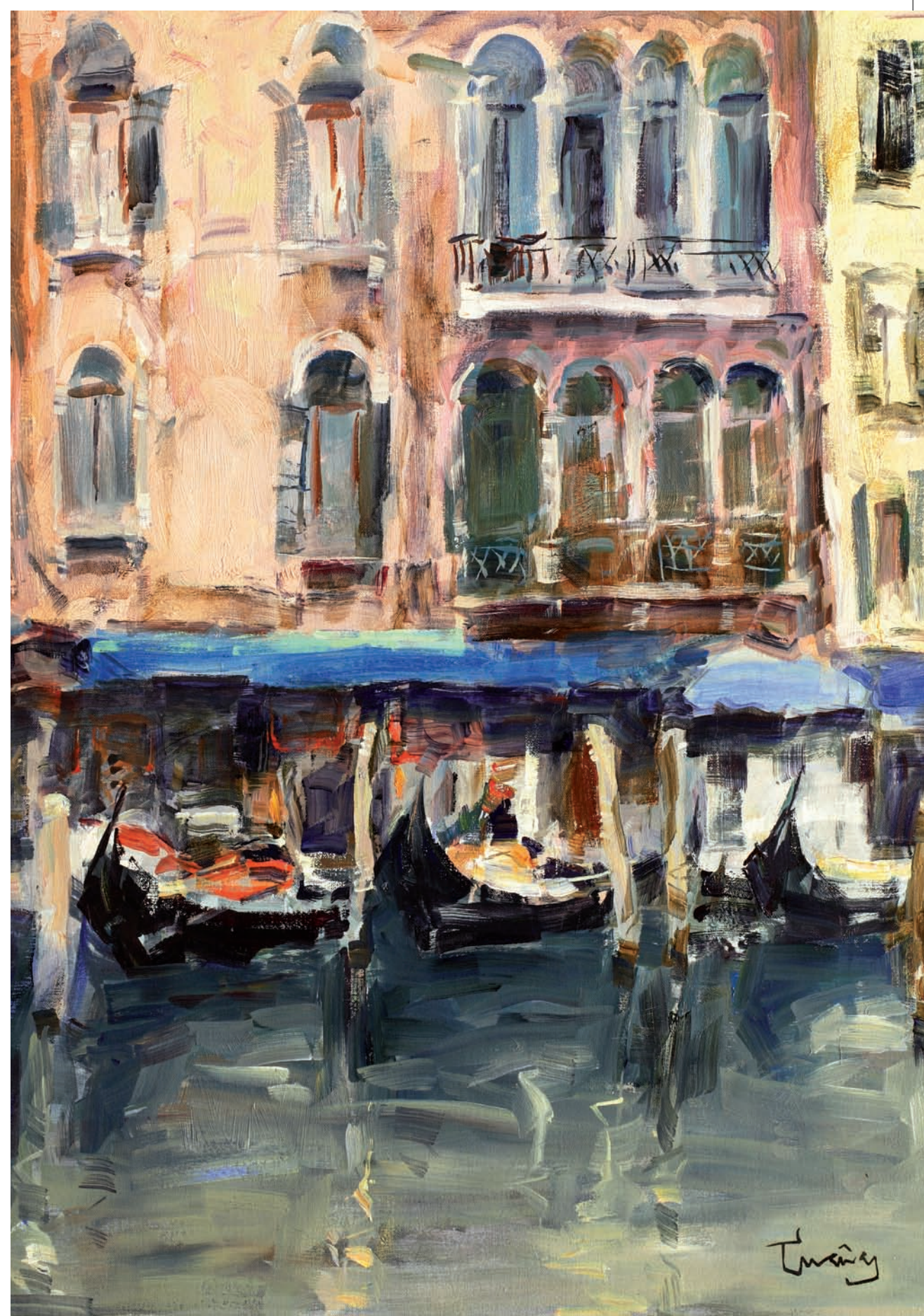
Gran Canal 73x60 cm. Oli sobre tela