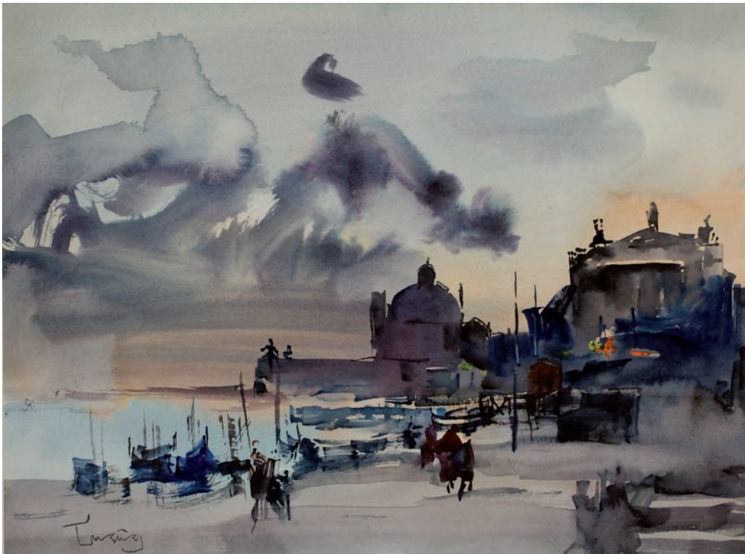
La Salute 45x60 cm. Acuarel·la